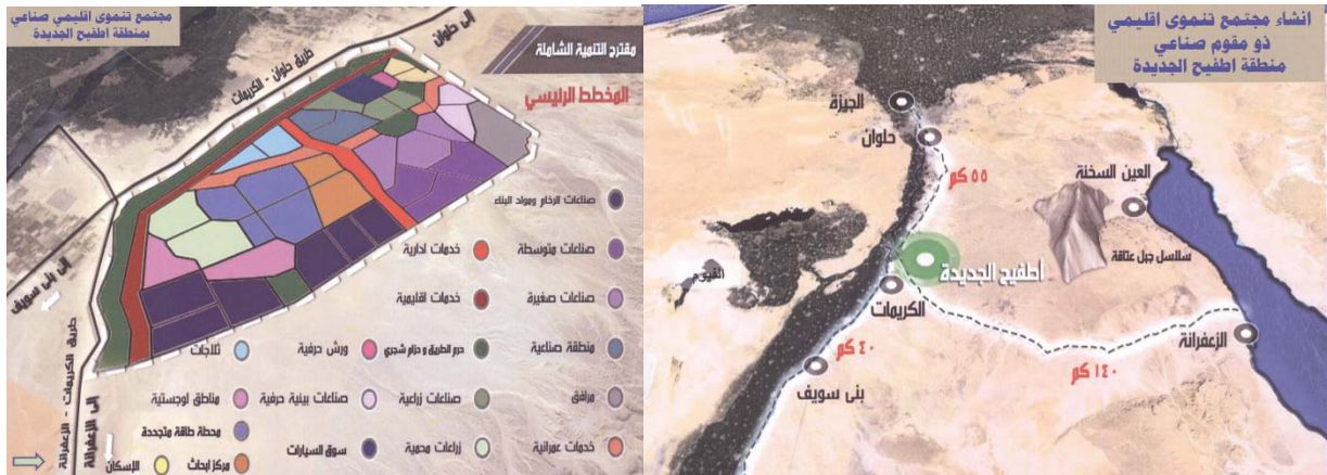
شكل رقم (5/أ، ب): موقع عام ومخطط استخدامات الأراضي لمشروع إنشاء مجتمعتنموي بمنطقة أطيح.