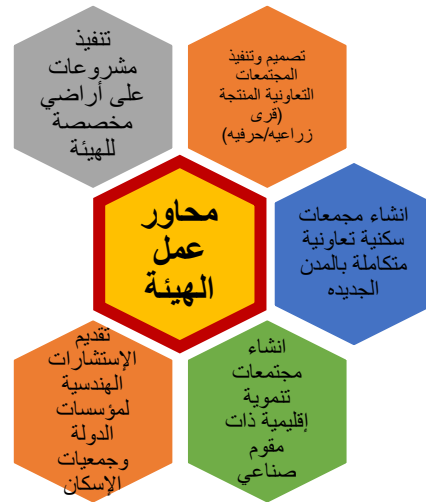
شكل رقم (2): محاور عمل الهيئة العامة لتعاونيات البناء والإسكان.

وقد تم عقد مؤتمر الدولي للإسكان التعاوني و الذي تم تنظيم دورته الأخيره عام 2014 ليحدد محاور العمل خلال الخطة الخمسية حتى عام 2017 من خلال فكر اسكان تعاوني جديد لإنشاء مجتمعات تعاونية منتجة زراعية وصناعية و حرفية تساهم في حل مشكلة البطالة وتعمل على تعمير محاور التنمية المستهدفة خارج الوادي و الدلتا. وهو ما يعد إضافة للمهام والإختصاصات التقليدية للهيئة من تنفيذ اسكان ذاتي او تعاوني بالمدن المختلفة. يوضح الشكل رقم (2) محاور عمل الهيئة.