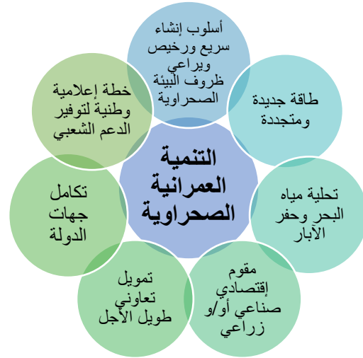
شكل رقم (3): مختصر منهجية عملية التنمية المستدامة لبنية عمرانية صحراوية منعزلة.

بعده مقومات اقتصادية مثل الصناعة والتجارة والنقل وتطبيق نظام سكني ريفي يعتمد على فكرة المنزل النواة أو الممتد الذي يمكن زيادة عدد الغرف السكنية فيه بمرور الوقت ليستوعب عدد أفراد أكبر للأسرة. شكل رقم (5).