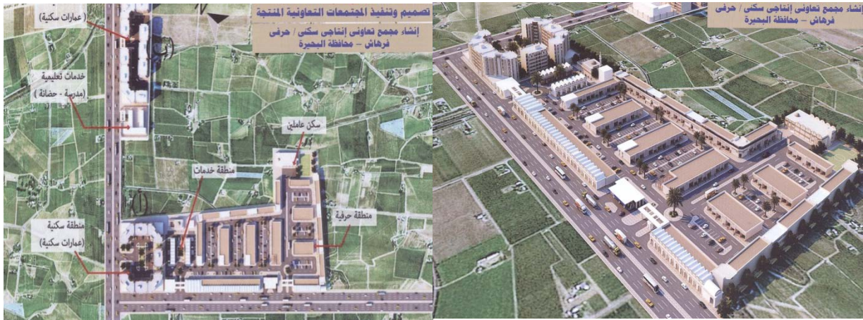
شكل رقم (4/أ، ب): موقع عام ومنظور لمشروع إنشاء مجمع تعاوني إنتاجي سكني حرفي.